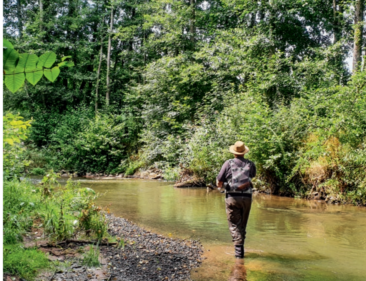
An einigen Stellen hat man an der Mümling auch Platz genug, um mit kurzen Ruten Überkopf zu werfen und den Rücken wieder gerade zu machen ...